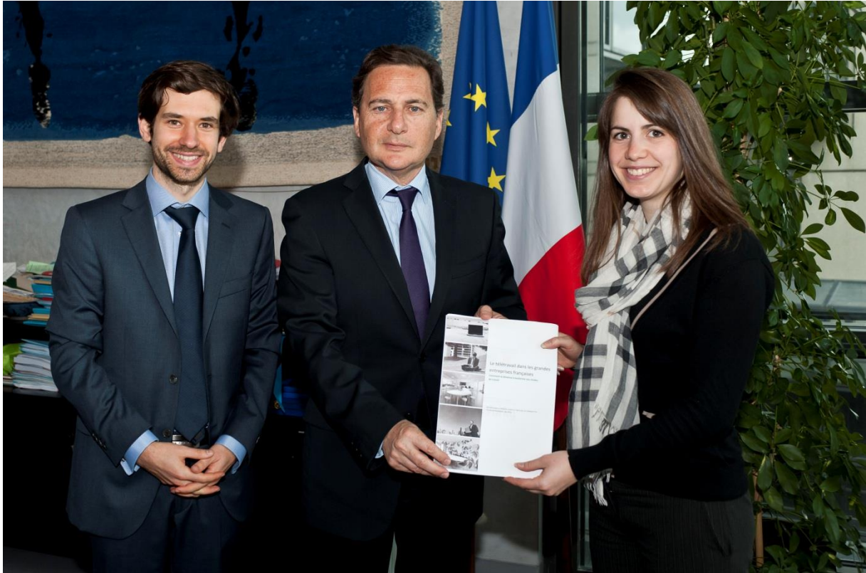
Remise officielle de l'étude sur le télétravail dans les grandes entreprises françaises à M. Eric Besson, Ministre chargé de l'Industrie, de l'Énergie et de l'Économie Numérique – 7 mai 2012